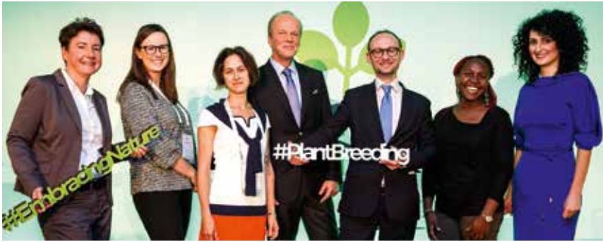
Das ESA-Team mit den Kampagnenhashtags #EmbracingNature und #PlantBreeding

der Auffassung des Generalanwalts folgt, so ist dies doch keineswegs sicher. Wir werden also die Position des Generalanwalts sicherlich sehr genau prüfen und Vermutungen über den Richterspruch anstellen; am Ende werden wir aber erst mit dem abschließenden Urteil wirklich wissen, woran wir sind.