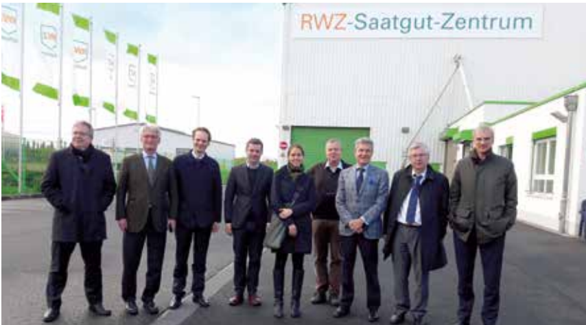
Der GRUR-Fachausschuss besichtigt die Saatgutaufbereitungsanlage der RWZ in Meckenheim.

Am 27. Oktober 2017 fand die Tagung des GRUR-Fachausschusses (Deutsche Vereinigung für gewerblichen Rechtsschutz und Urheberrecht e.V.) für den Schutz von Pflanzenzüchtungen in Bonn statt. Hierbei